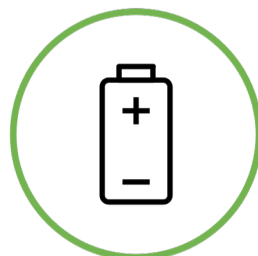
Óxido de prata